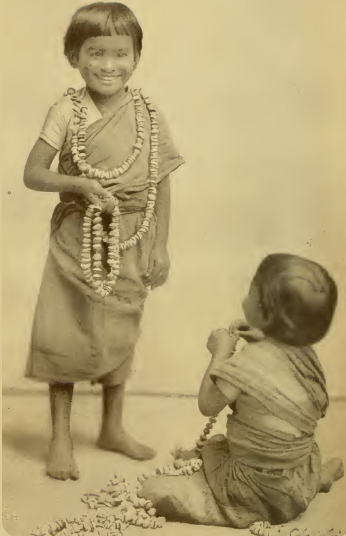
கீறிஸ்தவ வரலாற்றுச் சுவடுகள்

ஆம்... சரிதான் அண்ணன், அதற்காக ஜெபித்துக் கொண்டே இருக்கிறேன். குழந்தைகள் வளர்ந்து வருகிறார்கள்.