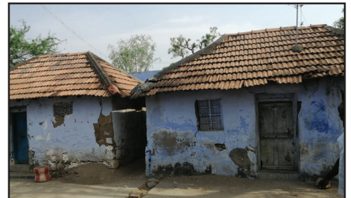
மரியான் உபதேசியார் வாழ்ந்த வீடு

அ ரி ஜ ன ம க் க ள ம் வெ கு வ ர க ஒடுக்கப்பட்டனர் என்பது தானே க ச ப் ப ா ன வ ர ல ா று . ஆ ன ா ல் இரு ப த ா ம்